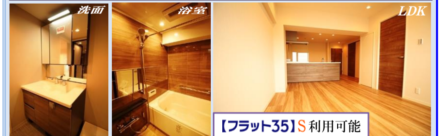
【フラット35】S利用可能

新規内装 ★トールタイプの玄関収納 ★食洗機付キッチン 設備充実 ★浴室追炊き機能&浴室乾燥暖房機 ★1316サイズの浴室