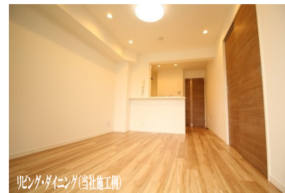
リビング・ダイニング(当社施工例)